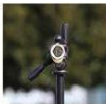
三脚に取り付けて