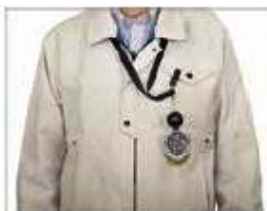
作業服の胸ポケット